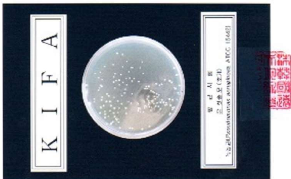
< 사진 3 >